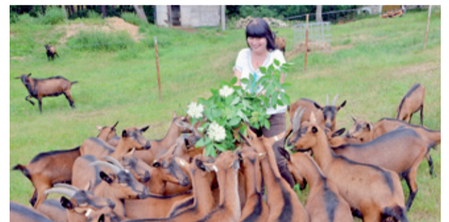
Menšie farmy dokážu v okolí bez problémov predať napríklad kozie syry, o ktoré je veľký záujem.